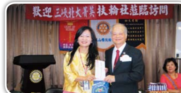
山櫻 Yuh 社長致贈小社旗予祿姆 PP Owan