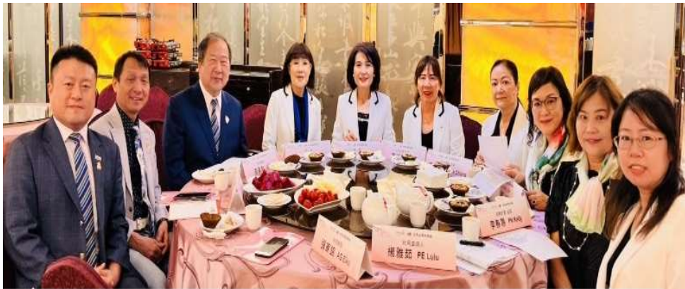
總監團隊與社長秘書及五大主委開會