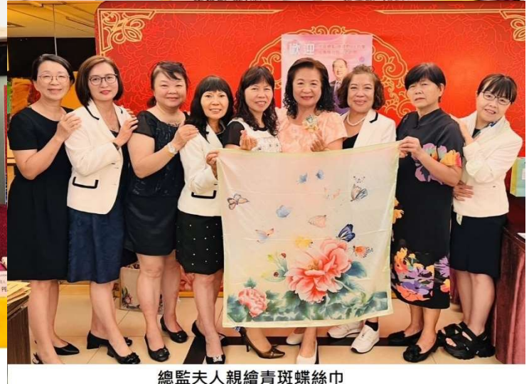
Victoria社長致贈小社旗予DG JSC