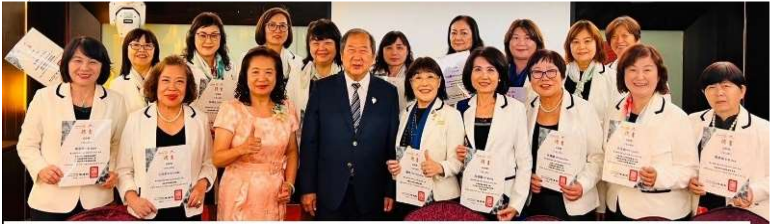
DG JSC 頒發地區聘書